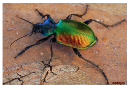
Calosoma sycophanta (Scarabée)

La Taxonomie au Service de la Conservation de la Biodiversité et du Développement Durable