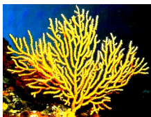
Eunicella cavolini (Gorgone jaune)

L'Association Tunisienne de Taxonomie (ATUTAX) a pour objectifs de :