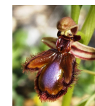
Ophrys speculum (Orchidée)

Pour toute information contacter +216 72 591 906 poste 257 nejib.daly@gmail.com et atutax@gmail.com