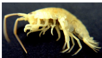
Talorchestia brito (Talitre)