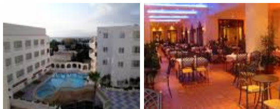
Vincci El Kantaoui Sousse